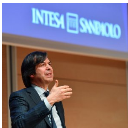
Il ceo di Intesa Sanpaolo, Carlo Messina

MILANO - Intesa Sanpaolo licenzia un trimestre con utile superiore alle attese: +12% a quota 901 milioni di euro, che diventano 1.183 milioni se si escludono i contributi e gli altri oneri riguardanti il sistema bancario. Il livello di utile che si aspettavano gli analisti era di 780 milioni e quello del primo trimestre 2016 era stato di 806 milioni di euro. Tra le voci che pesano sui conti, c'è una nuova svalutazione da 261 milioni della quota detenuta nel fondo Atlante, il veicolo che ha realizzato le ricapitalizzazioni delle banche venete ed opera nel settore delle sofferenze. Quota che per altro era già responsabile di rettifiche di